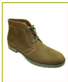
9061 AH Castanho

Está autorizada a utilizar o rótulo Biocalce Básico, em calçado de Homem de acordo com as especificações expressas no boletim de ensaios: CQ-730/2008 de 26/09/2008 para o seguinte artigo: